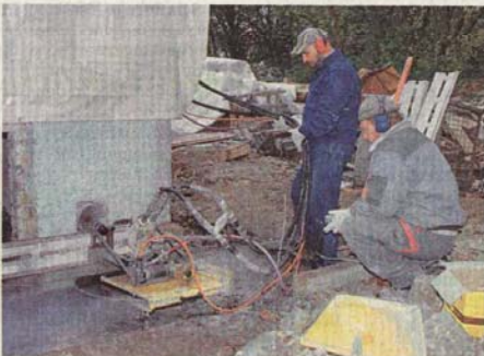
Erst wurde das einstige Kaufhaus leerräumt und von der Grundmauer mit einer Steinsäge getrennt. Nächste Woche wird es abtransportiert.