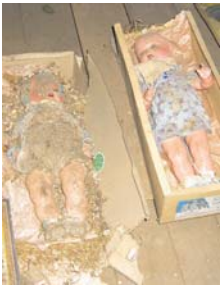
Beim Abbau wurden auf dem Speicher noch zahlreiche Schätzchen gefunden.