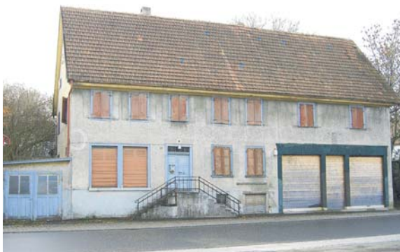
Dieses Bild entstand im Dezember 2006, kurz bevor mit den Abbrucharbeiten wurde.