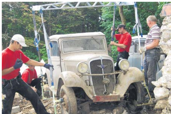
Ganz vorsichtig wurde der alte Hanomag von einem Kran angehoben.