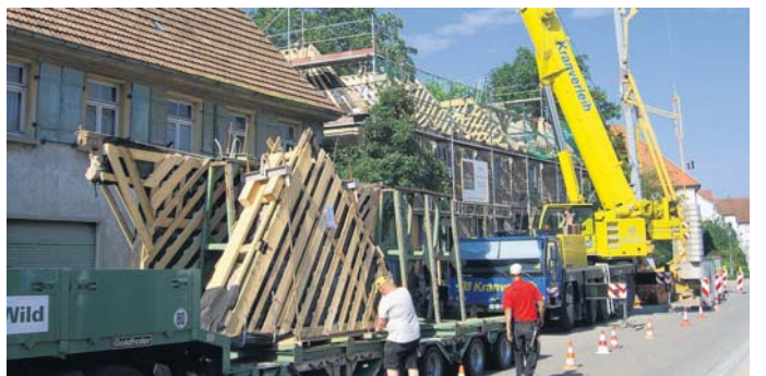
Zug um Zug wurde das historische Gebäude abgebaut und per Tieflader in die Montagehalle nach Rot an der Rot transportiert, wo die Teile restauriert und wieder zusammengesetzt werden.