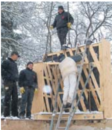
Der Winter war schon eingebrochen, als die Experten der Firma Jako Bau den letzten Teil des Erdgeschosses abbauten.